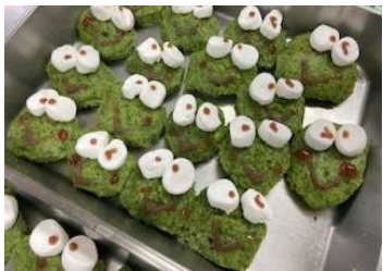
けろけろけろっぴ